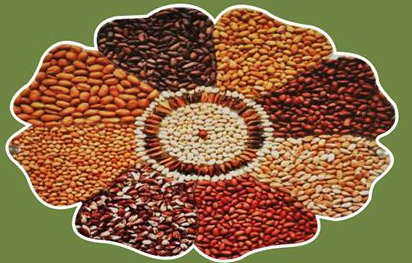
Seed Colour Variation