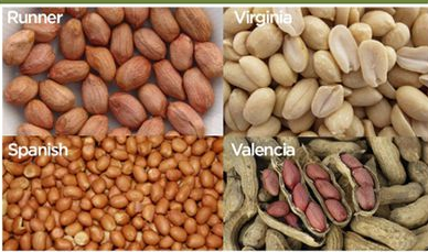
Types of Groundnut